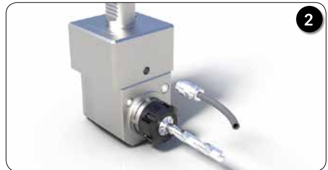
Démontage du tube de lubrification, de l'écrou de serrage ER et de l'outil coupant