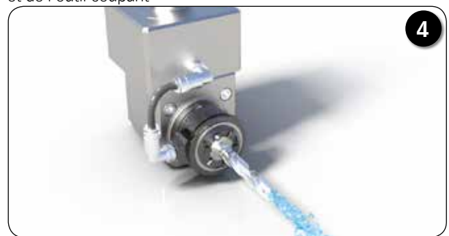
Utilisation de la lubrification par l'arrosage central grâce au système reCool®