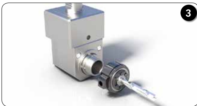
Montage du système reCool®, du disque d'étanchéité et de l'outil coupant